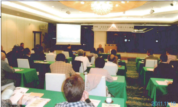
【ホテル プリムローズ大阪】