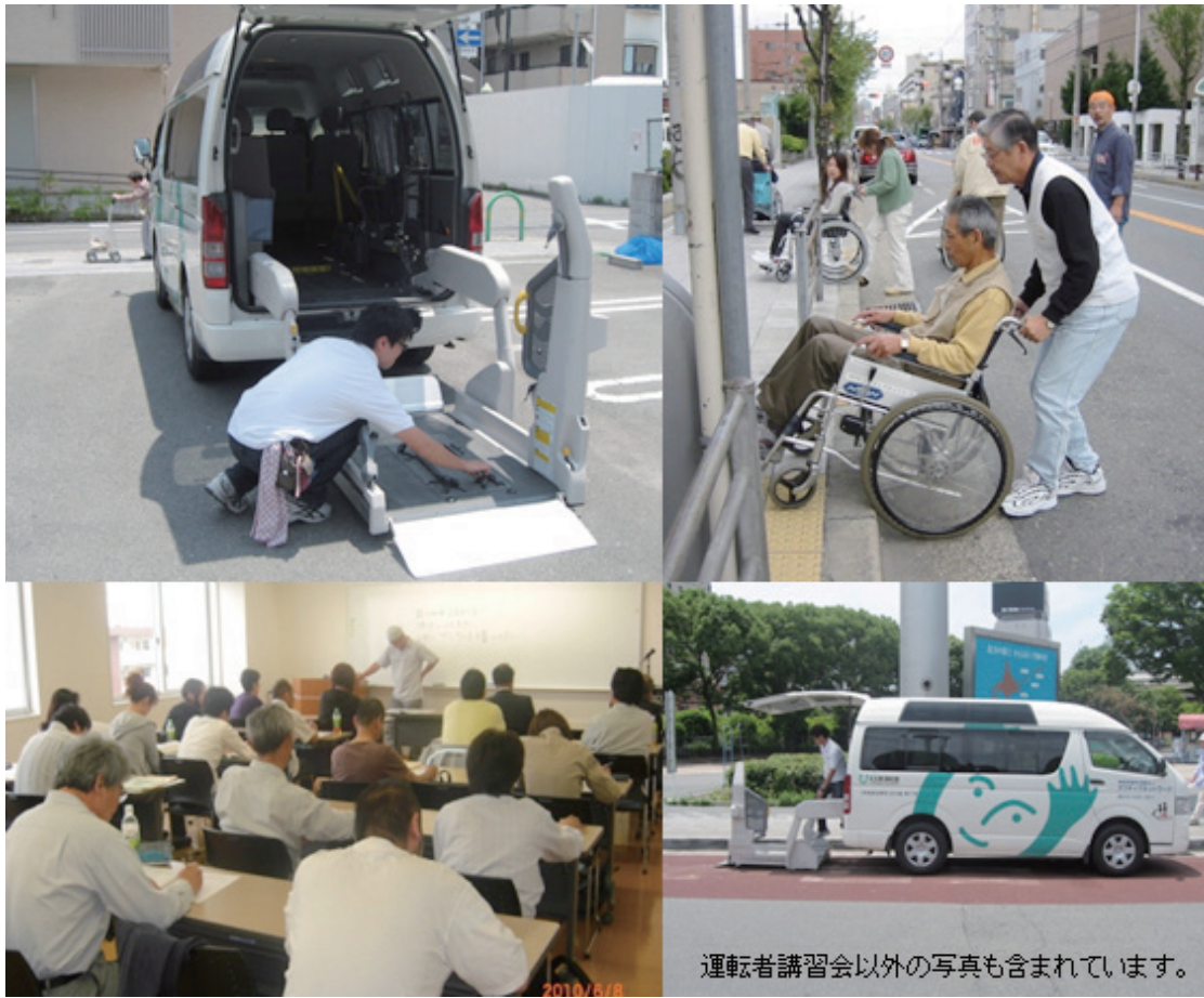
運転者講習会以外の写真も含まれています。