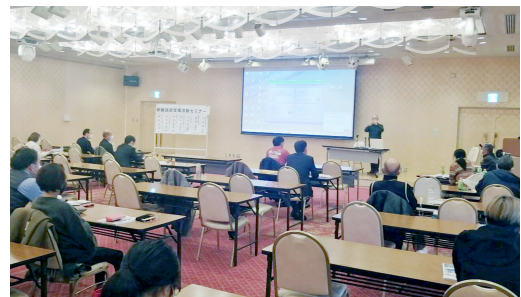
▲2021年1月の移動送迎支援活動セミナー風景

そうした状況は、交通空白地域対策、介護予防の推進、買物難民問題、高齢者免許返納促進などの社会情勢の緊迫化がそうさせてきている