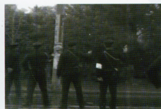
4・24の時、警官隊は20発撃った