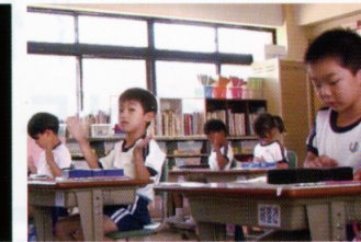
授業は母国語で行われる