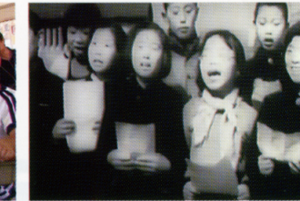
戦後間もない朝鮮学校の児童たち