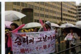
「差別するな」と訴える人々