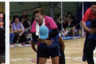
ハッキョと地域の人々が一体となる運動会