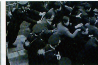
1951年、東京朝鮮中高級学校弾圧