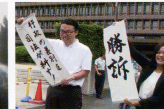
歴史的な大阪地裁の勝利判決