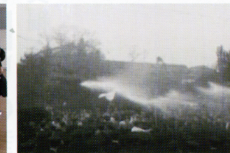
1948年、阪神教育闘争のニュース映像