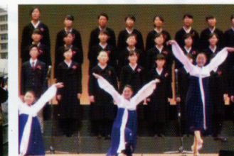
朝鮮高級学校卒業生公演