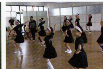
伝統舞踊を習う児童