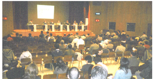
関西STS連絡会セミナー風景(2006.3)