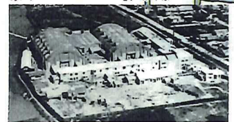
② 堺市長瀬撮影所跡 ③ 長瀬撮影所